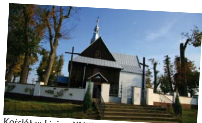
Kościół w Lipie z XVIII w.

Najcenniejszym obiektem miejscowości jest kościół św. Wawrzyńca i św. Katarzyny stojący wśród rosnących lip. Początki tej świątyni sięgają aż 1129 r., kiedy miał tu powstać pierwszy modrzewiowy kościół. Jednak obecna budowla, najprawdopodobniej trzecia, swe początki ma w roku 1764 i została zachowana do dnia dzisiejszego.