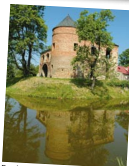
Dwór obronny z XVI w.