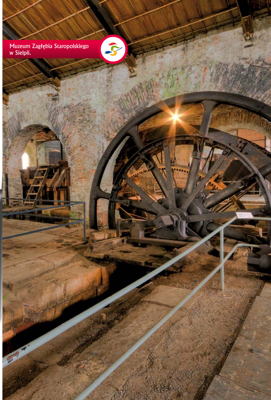
Muzeum Zagłębia Staropolskiego w Sielpii.