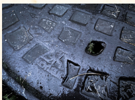
Zdj. nr 6

Najedź aparatem telefonu na ten kod i odnajdź istniejącą do dziś studzienkę wyprodukowaną przez Zakład Szai Kronenbluma